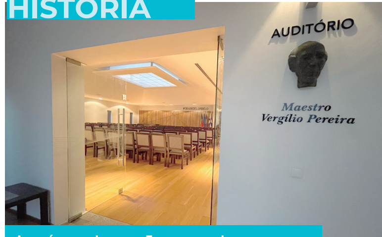
AUDITÓRIO DA JUNTA DE FREGUESIA DE LORDELO